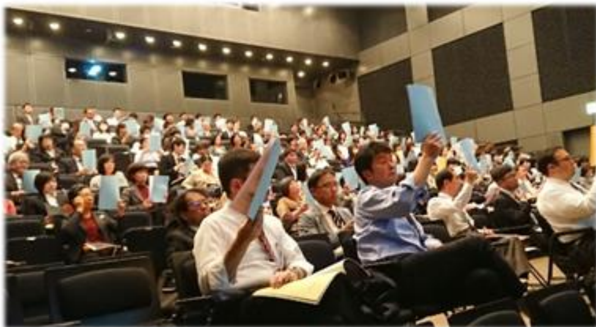
<第49回岩手県公立小中学校事務研究大会 全体研究会>